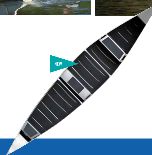
520 CANOE SILVER/GREEN