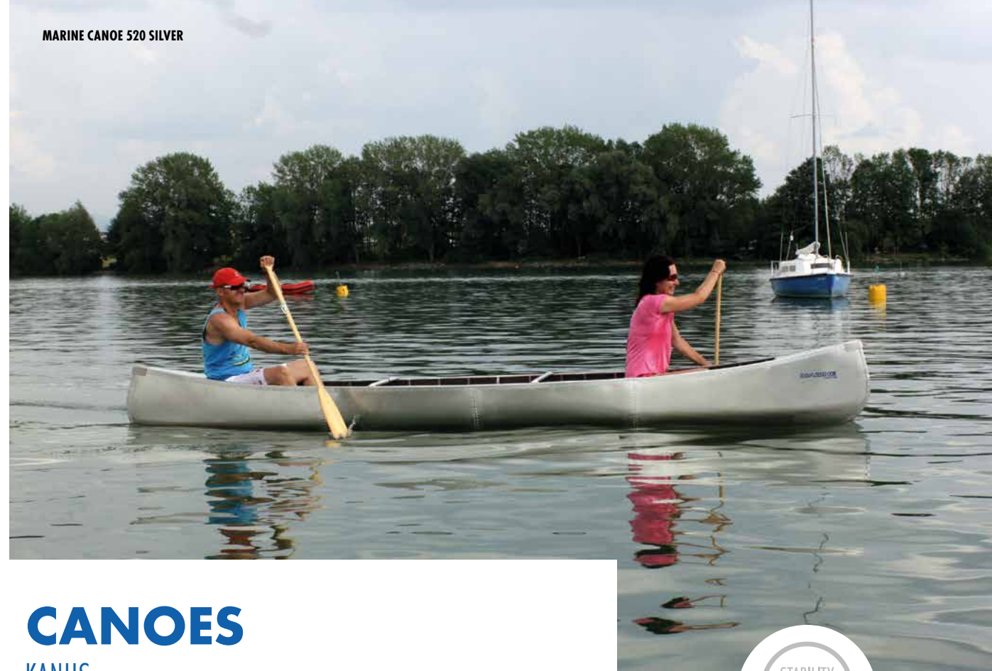
MARINE CANOE 520 SILVER